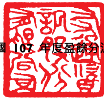
民國107年度盈餘分派表

說明：一、本公司107年度盈餘分派，擬依公司法暨公司章程規定，股東股利每股配發現金新台幣5.28元，即每仟股配發現金5,280元。 二、107年度盈餘分派表如下： 三、本次現金股利俟股東常會通過後，由董事長另訂配息基準日及配發現金股利等相關事宜。 四、本次盈餘分派案，如因本公司流通在外股數發生變動，致使配息率異動而需修正時，擬請股東會授權董事長全權處理。